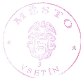
Květoslava Othová starostka města Vsetín