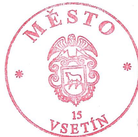
Jiří Čunek starosta města Vsetína